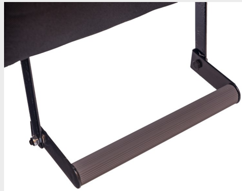
Apoyapiés modelo U2/ U2 model footrest