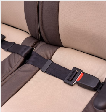
Cinturón fijo de 2 puntos/ 2-point fixed seat belt