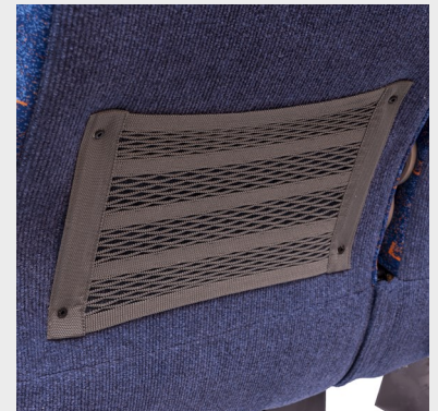
Revistero de malla gris (Autonet)/ Gray mesh magazine holder (Autonet)