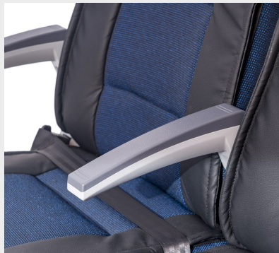
Brazo modelo EGA/ EGA model armrest