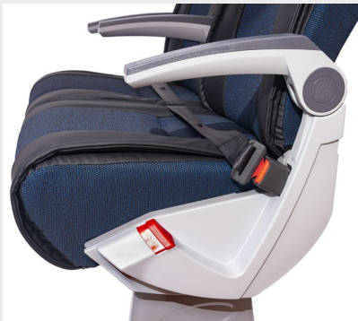
Lateral modelo EGA/ EGA model side shell